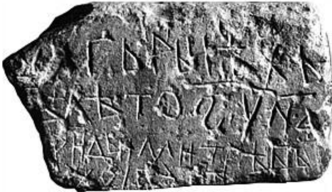
Jupan Dimitrie inscriptie 943